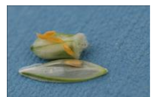
Larver af hvedegalmyg på hvedekerne.

Flyvningen af den orangegule hvedegalmyg kan følges via fangst i feromonfælder. Fælderne opsættes i hvedemarkerne, når fanebladet er udviklet. Anskaf selv feromonfælder. Fælderne kan købes hos Frøsalget. Fra England angives en bekæmpelsestærskel på 120 hvedegalmyg pr. fælde pr. dag, såfremt hveden samtidig er i vækststadium 41-61 (begyndende skridning til begyndende blomstring). Ved en fangst mellem 30-120 hvedegalmyg pr. fælde pr. dag er det usikkert, om bekæmpelse er rentabelt. Følg forekomsten af hvedegalmyg i registreringsnettet .