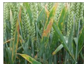
Kraftige angreb af Septoria på fanebladet. Septoria er den vigtigste svampesygdom i hvede og den sygdom, som aksbeskyttelsen oftest er rettet imod.

Ved forfrugt hvede/triticale og samtidig reduceret jordbearbejdning kan det i år med fugtige forhold omkring blomstring være aktuelt at bekæmpe aksfusarium for at reducere indholdet af fusariumtoksiner. Et lavere toksinindhold kan kun værdisættes,