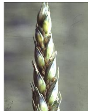
Bladlusene i hvede er lette at ramme, da de sidder i aksene.

Bladlus kan overføre havrerødsotvirus om efteråret. Risikoen er størst ved tidlig såning og et langt mildt efterår. Bekæmpelse med et pyrethroid i efteråret anbefales kun undtagelsesvis. Følg varslingen . Hold øje med forkomsten af bladlus i marken. Hvis bekæmpelse udføres afsæt da et usprøjtet vindue til vurdering af effekt.