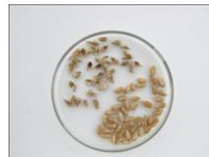
Kerner angrebet af hvedegalmyg øverst til venstre.

Anvend 1/4 til 1/2 dosis af et godkendt pyrethroid til bekæmpelse. Afsæt et usprøjtet vindue for at vurdere effekten af sprøjtningen.