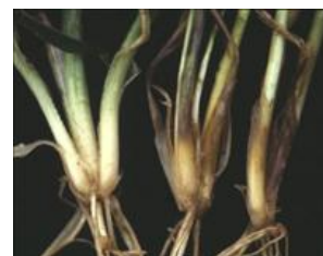
Planter angrebet af knækkefodsyge til højre