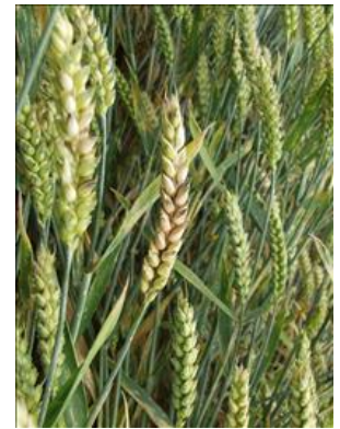
Angreb af aksfusarium viser sig ved, at et eller flere småaks nødmodner. I fugtigt vejr ses en rødlig svampebelægning.

Se løsningsforslag . I forsøg er der med 0,6 l/ha Proline (75 procent normaldosering) under blomstring kun opnået 35-50 procent reduktion af toksinindholdet. I løsningsforslag er angivet løsningsforslag med doser på 50 procent normaldosering. Har du mistanke om at vinterhveden er angrebet af aksfusarium, bør du få foretaget analyser af afgrøden og holde den adskilt fra den øvrige avl, således at det er muligt at "fortynde" den angrebne vare, så indholdet af toksiner kan holdes under grænserværdierne. Se mere her .