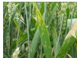
Angreb af hvedebladplet også kaldet DTR.