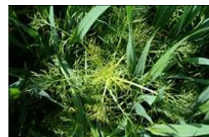
Kamille, der har overlevet efterårssprøjtningen, bør bekæmpes tidligt, så ukrudtsplanterne ikke som her når at konkurrere med afgrøden.

Knækkefodsyge er mest tabsvoldende, hvis angrebet resulterer i lejesæd. Via dyrkningsteknikken (sortsvalg, udsædsmængde, kvælstof-strategi) kan svampens betydning derfor reduceres.